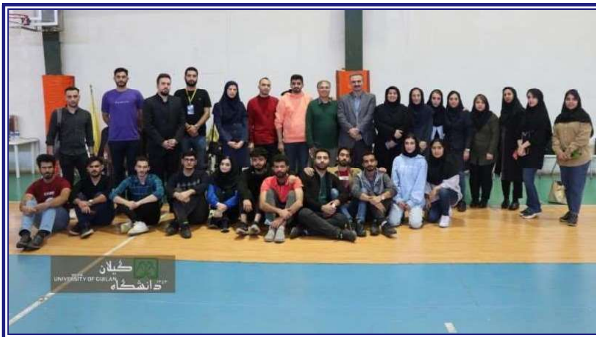
جمعی از اعضای تیم اجرایی مسابقه شهر ریاضی

دانشگاه برگزار شد. حضور خانواده‌های دانش‌آموزان در این مراسم بسیار پرشور بود.